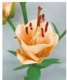
ユリ属の園芸品種 'アプリコット・ファッジ'