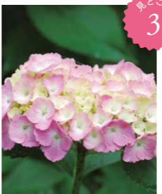
アジサイ属の園芸品種 'ミセス・クミコ'