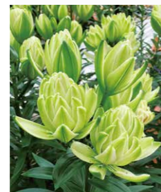
ユリ属の園芸品種 'ミステリー・ドリーム'